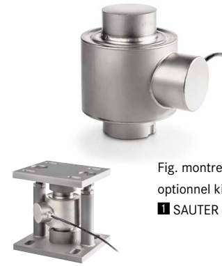
Fig. montre l'accessoire optionnel kit de montage ■ SAUTER CE P41430